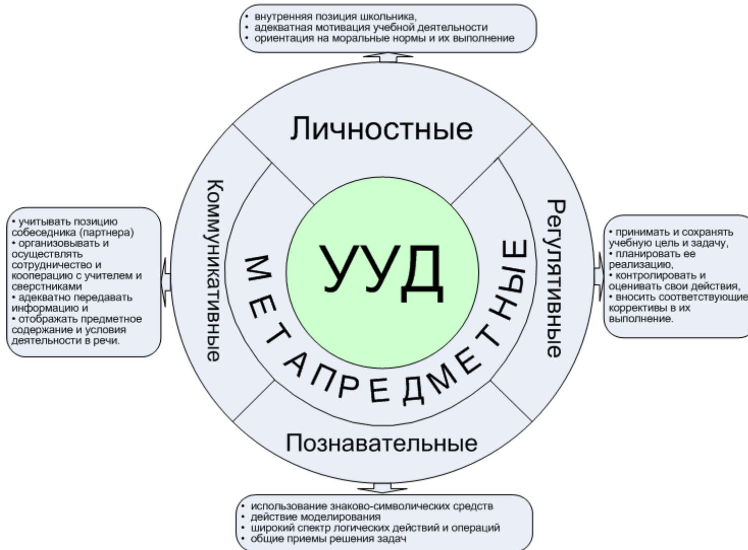
Рисунок 1. Универсальные учебные действия.